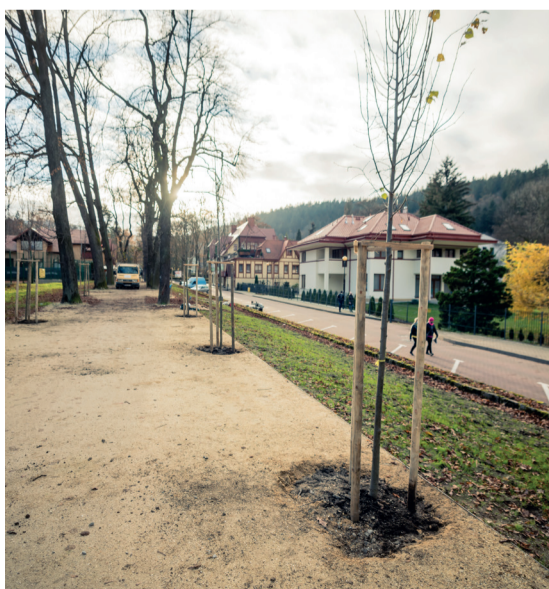
Na alei wykonano nowe nasadzenia, na montaż oczekują już nowe lampy i ławki