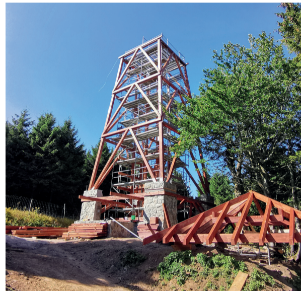
Tak wyglądała wieża jeszcze we wrześniu