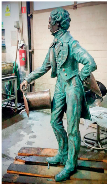
Figura mająca zdobić źródło "Felix" jest już gotowa