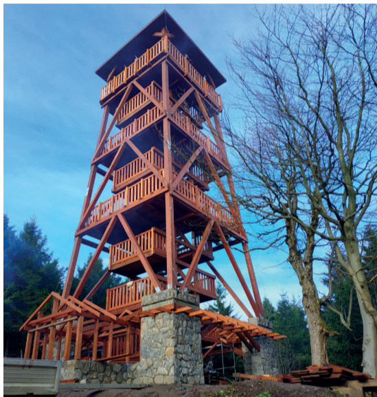
Prace na Orlicy przebiegają bez zakłóceń