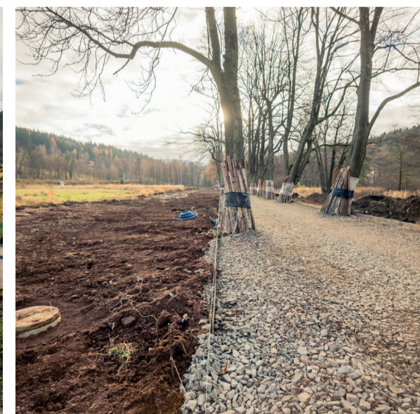
W wyniku dodatkowych prac zlikwidowano rów wzdłuż alei i uratowano kilka kasztanowców