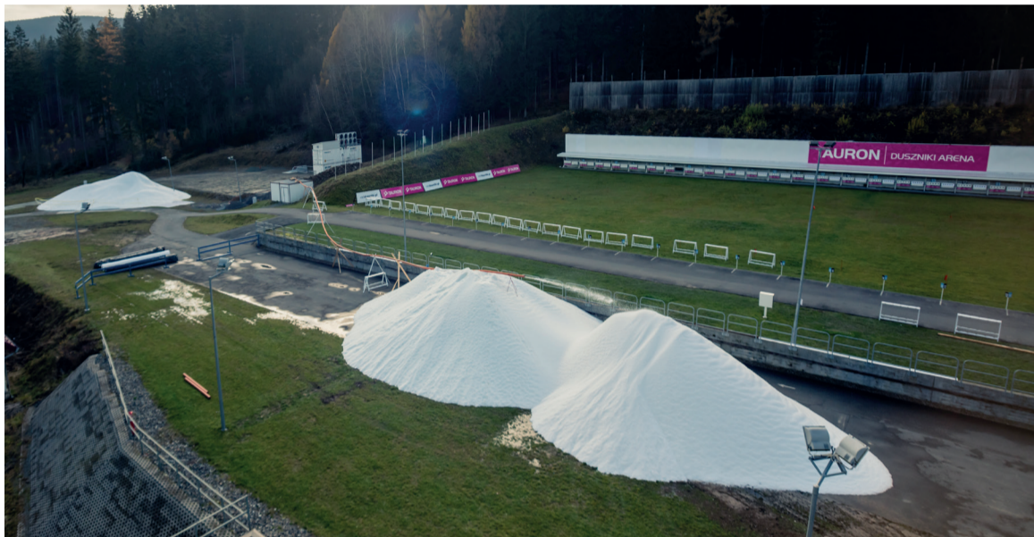
Śnieg wytworzony przez SnowFactory jest składowany w przyzmach, których temperatura wewnętrzna wynosi -7°C

Produkcję śniegu na Tauron Duszniczy Arena w tym roku rozpoczęto wyjątkowo wcześniej, bo już 3 listopada. Było to możliwe dzięki instalacji o nazwie SnowFactory, wypożyczonej do testów. Urządzenie na dusznicki stadion biathlonowy dostarczył włoski producent sprzętu do naśnieżania – firma TechnoAlpin.