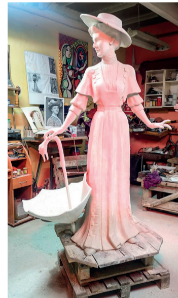
Zakończyły się prace nad formą figury księżnej Agaty