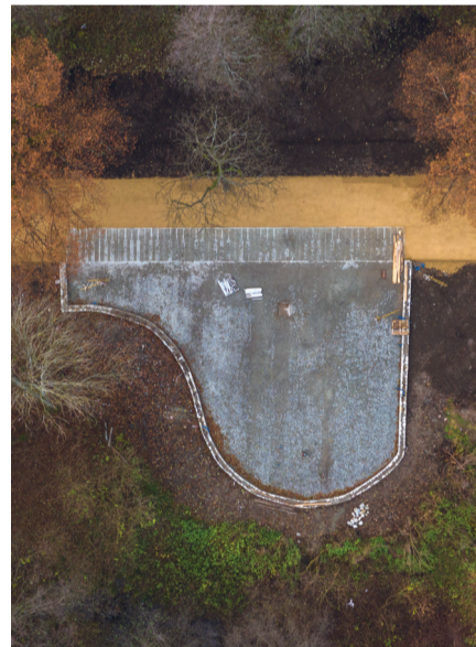
Otoczenie źródła "Agata" będzie miało kształt fortepianu