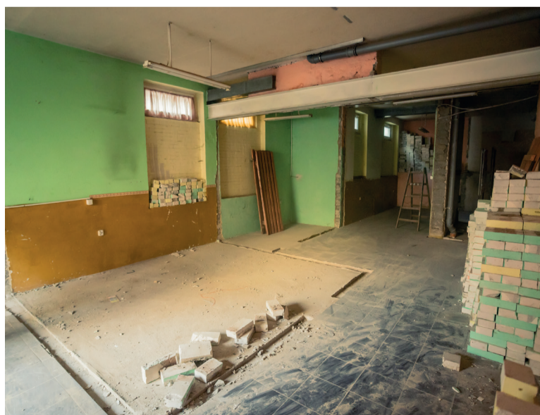
Rozpoczęto prace przy nowym Klubie Seniora. Wykonawcą inwestycji jest firma Roboty Ogólnobudowlane FHU Krzysztof Onyszczyk