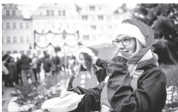
Kolejna wspólna wigilia mieszkańców