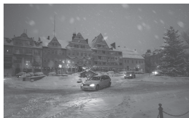
Zima w mieście