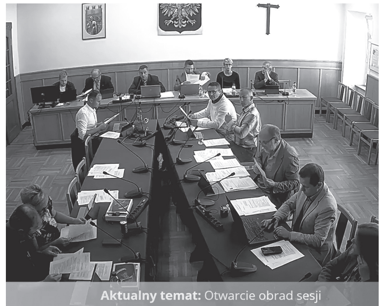
Aktualny temat: Otwarcie obrad sesji

Kolejny temat przeglądu to modernizacja i rozbudowa obiektu biathlonowego na Jamrozowej Polanie, no i oczywiście organizacja Mistrzostw Europy w Biathlonie w 2017 r. Dalej to, co na Duszniaki Arena się działo – m.in. „Olimpy Sportu”, finał czeskich zawodów w biegach narciarskich