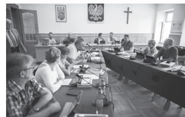
Relacja z 63. sesji Rady Miejskiej