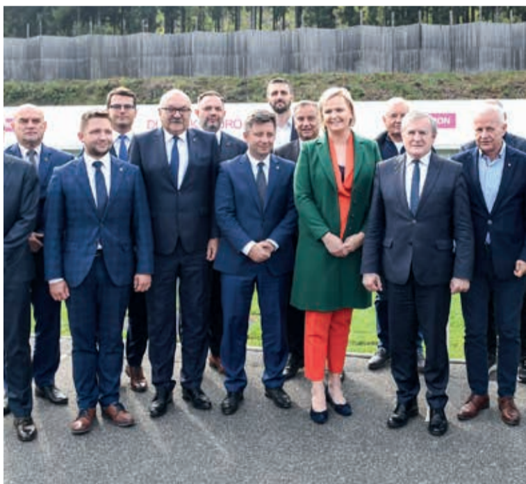
Sprzedaż miejskich nieruchomości, które będą tworzyły Centralny Ośrodek Sportu – Ośrodek Przygotowań Olimpijskich w naszym mieście, po raz kolejny była przedmiotem dyskusji na forum Rady Miejskiej. Przypomnijmy, że powołanie COS OPO Duszniki-Zdrój ogłoszono uroczystie 23 września ub. roku na Jamrozowej Polanie w obecności przedstawicieli władz państwowych, regionalnych i lokalnych (fot.).

Burmistrz przypomniał, że przypadków nadzwyczajnego trybu włączania projektów uchwał do porządku obrad było wiele. Zwrócił uwagę, że na taką zmianę musi zgodzić się więcej niż połowa pełnego składu rady. A dlaczego sporny projekt nie został przedstawiony radnym wcześniej? Bo wniosek starosty w tej sprawie wpłynął do gminy dopiero 17 maja. A przecież wszystkim zależy, żeby pieniądze ze sprzedaży spłynęły na konto gminy jak najszybciej. Zdaniem Lewandowskiego projekt uchwały nie powinien budzić kontrowersji , ma bowiem znaczenie jedynie symboliczne.