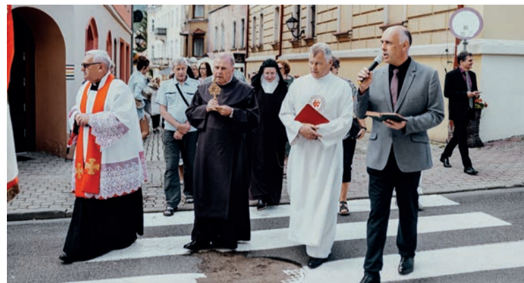
Relikwie Edyty Stein wprowadzono do kościoła procesją spod jej pomnika na ul. Mickiewicza