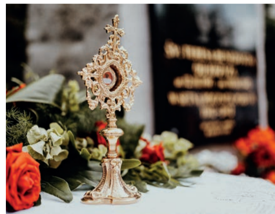
Relikwie świętej, które przekazane zostały do dusznickiego kościoła św. św. Piotra i Pawła

Pokochałem wasze miasto i dzięki poznaniu wielu przyjaciół została bardzo ubogacona moja osobowość.”