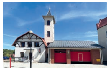
Nowa remiza OSP otwarta