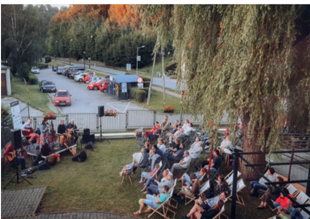
Koncert Ireny Salwowskiej z zespołem zebrał liczną publiczność