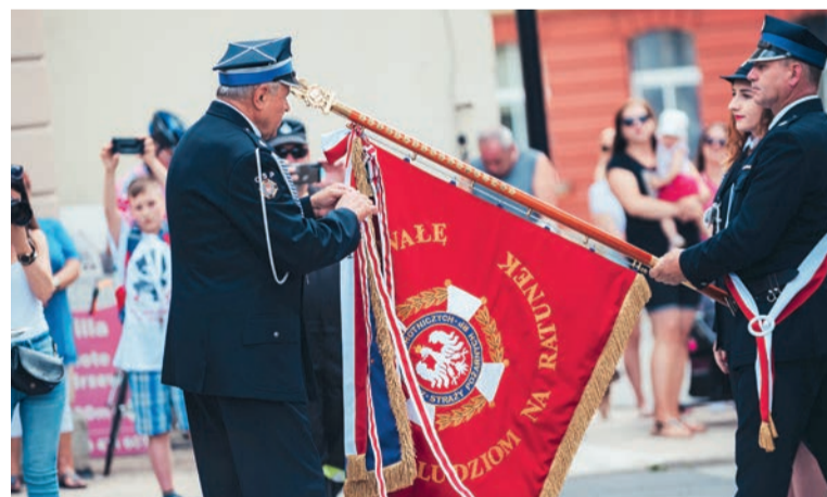
Duszyncka jednostka otrzymała złoty medal "Za Zasługi dla Pożarnictwa"