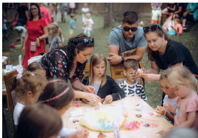
Program przepełniony był licznymi warsztatami i zabawami dla najmłodszych