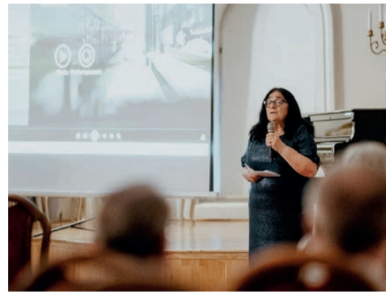
Seans filmu „Edyta Stein. Patronka Europy” poprzedziło wprowadzenie reżyserki Bogusławy Stanowskiej-Cichoń