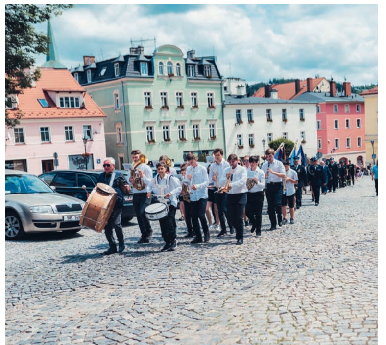
Uroczystość rozpoczęła parada strażacka z orkiestrą dętą ze szkoły muzycznej w Hronowie