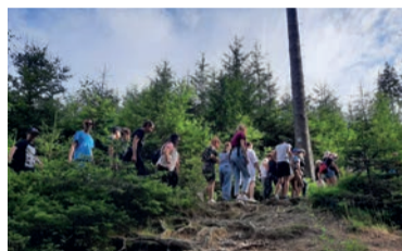
Wakacje w mieście