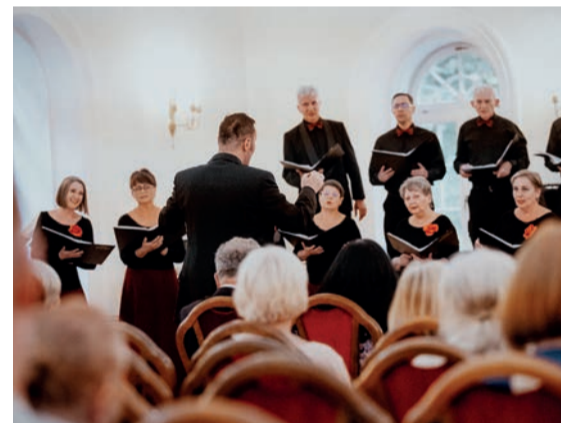
Konferencję uświetnił występ Chóru Madrygał z Legnicy