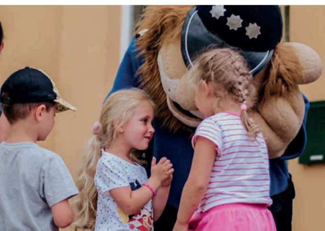
Na pikniku najmłodszych uczestników odwiedził Komisarz Lew