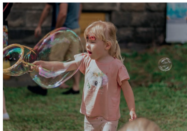
Organizatorzy zadbałi o wybór rozrywek dla wszystkich dzieci