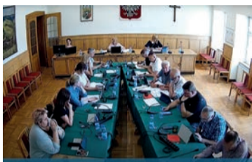
Relacja z 51. sesji Rady Miejskiej