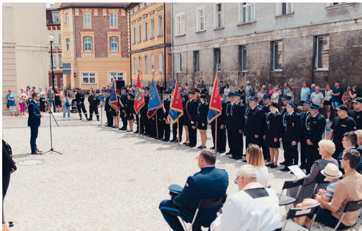
W uroczystości udział wzięły poczty sztandarowe z jednostek straży pożarnej w Lewinie Kłodzkim, Czermnej (Kudowa-Zdrój), Polanicy-Zdroju i Szczytnej. Na drugim planie licznie zgromadzeni mieszkańcy miasta