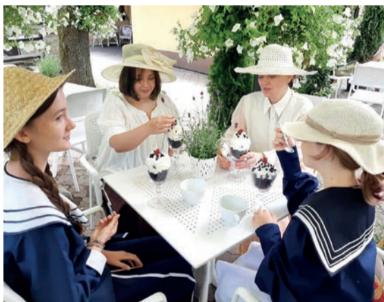
Nakręcono pierwsze sceny do filmu, który będzie opowiadał o pobycie Edyty Stein w naszym mieście