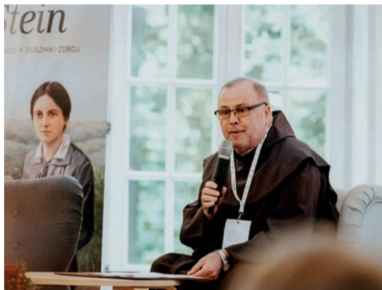
Na konferencji gościliśmy o. Szczepana Praśkiewicza, bliskiego współpracownika papieża Franciszka