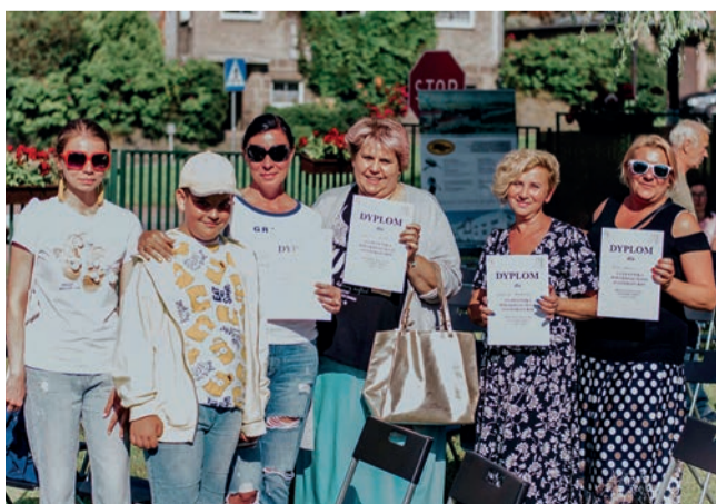
Uczestnicy Wielkiego testu o literaturze