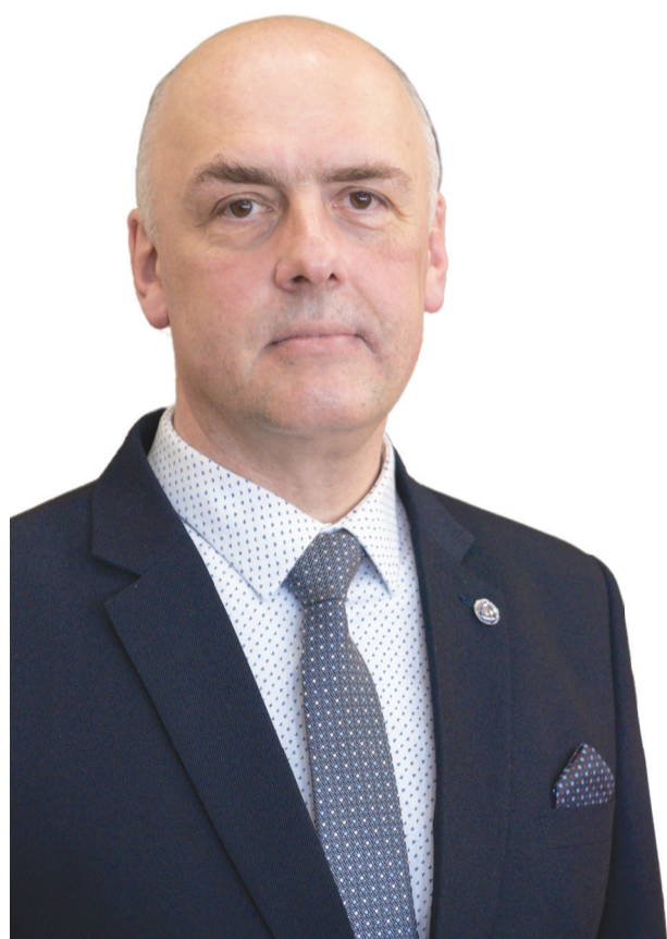
Przemysław Kuklis BURMISTRZ DUSZNIK-ZDROJU