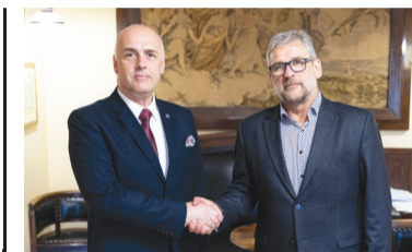
COS z nowym dyrektorem