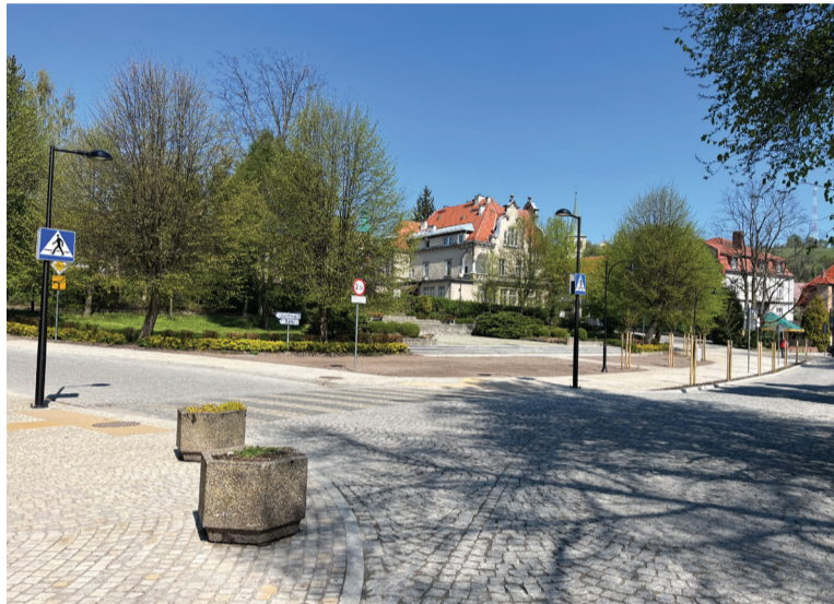
Plac Warszawy oczekuje na zaplanowe poprawki

Oszczędzać gminie na wydatkach na energię elektryczną pomoże również farma fotowoltaiczna przy ul. Po-