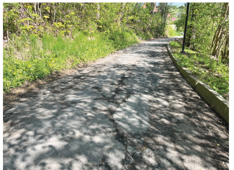
Nawierzchnia ul. Orzechowej już dawno wymagała remontu

lnej. Choć prace budowlane zakończyły się już w zeszłym roku, to nadal trwają te formalne pomiędzy gminą, a spółką Tauron. Po kilku miesiącach oczekiwania 4 kwietnia br. Tauron dokonał podłączenia farmy do swojej sieci. Nie jest to jeszcze jednak koniec formalności. Obecnie przygotowujemy umowę sprzedażową dla gminy oraz karta danych technicznych farmy. Po dopełnieniu tych formalności wreszcie będziemy mogli cieszyć się z „czystego prądu” w naszej gminie. Przypomnijmy, że farma w ciągu roku powinna wyprodukować ok. 149 tys. kWh prądu. Czy to dużo? Przed wymianą lamp oświetlenia ulicznego na LED-owe gmina na ten cel rocznie zużywała ponad 530 tys. kWh. Po modernizacji i uruchomieniu farmy koszty gminy powinny spać o ok. 70%. Wymiana pozostałych lamp powinna pozwolić nam wytworzenie nadwyżki energetycznej z farmy, którą wykorzystywać będzie można np. na oświetlenie budynków publicznych.