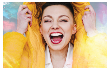
Majówka z DOK-iem