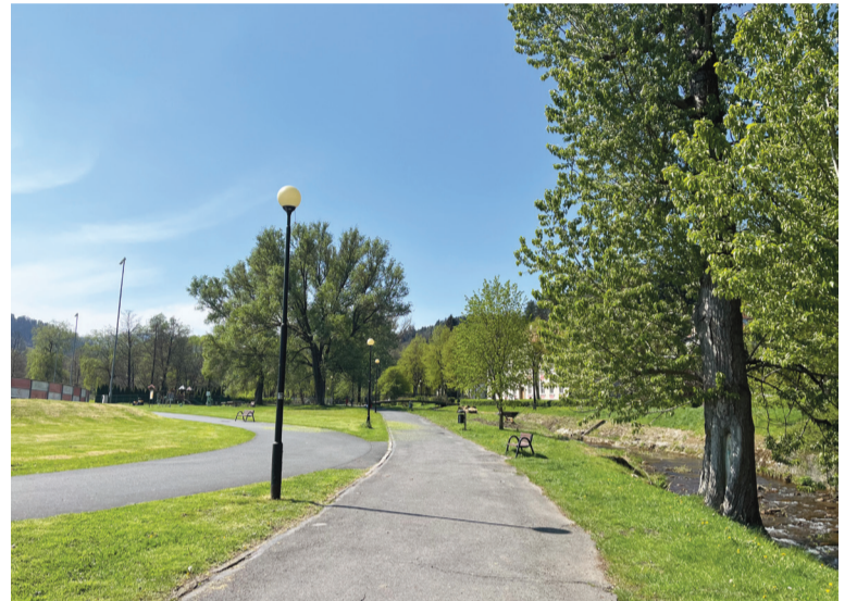
Aleja Sybiraków już wkrótce zyska nowe oświetlenie