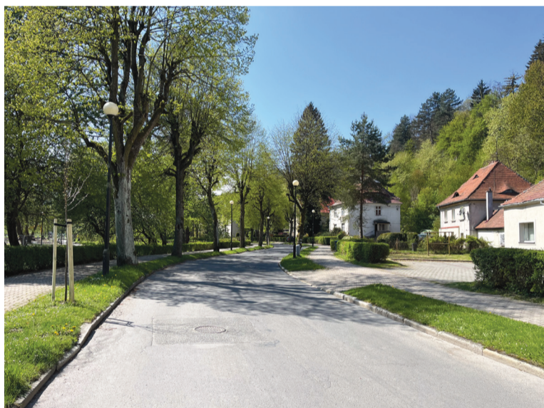
Modernizacja ul. Zdrojowej będzie jedną z największych inwestycji w tym roku